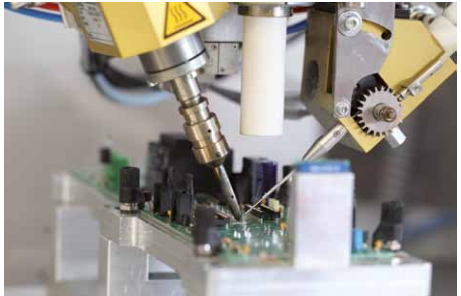
Bleifreies Löten bei der Krug & Priester GmbH & Co. KG, Balingen

zahlreichen Zulieferern in der Umgebung. Deshalb ist die Verlagerung der Produktion in Billiglohnländer genauso tabu wie der Umzug der Firmenzentrale in Steuerparadiese. Eine niveauvolle Ausbildung und Fortbildung sowie ein fairer Umgang mit den Mitarbeitern spiegeln sich in der sehr geringen Fluktuationsrate und der überdurchschnittlich langen Beschäftigungsdauer wider.