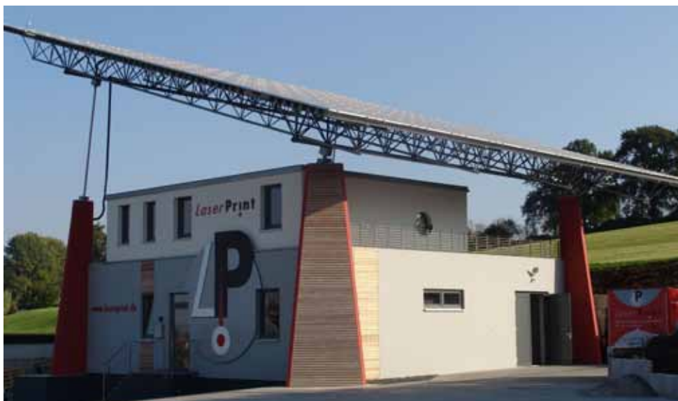
Der neue Firmensitz von Laserprint (mit "Solardach") in Langenau-Albeck

Auch wenn die Zertifizierung auf Anhieb und ohne Abweichungen erfolgte, so ergaben sich im Auditbericht Hinweise und Empfehlungen, was wir bis zum nächsten Überwachungsaudit verbessern könnten. Diese Hinweise und Empfehlungen sind für uns ein sehr guter Anhaltspunkt für unsere nächsten Qualitätsziele und entsprechenden Maßnahmen zur weiteren Qualitätsverbesserung.